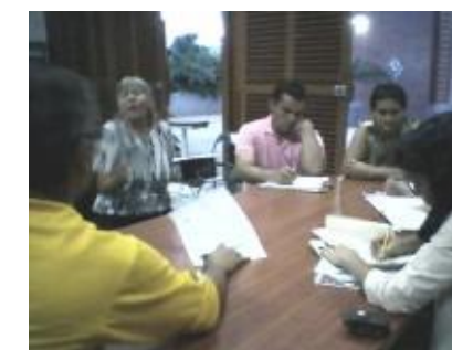
Reunión intempestiva en la Escuela Vivero y Museo Geológico Guariya