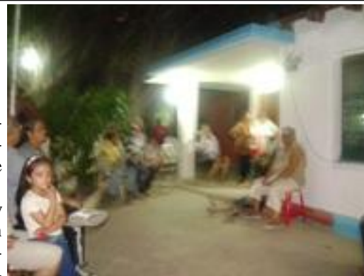
Asamblea de Ciudadanos y Ciudadanas para elegir las 2da Comisiones Promotora y Electoral