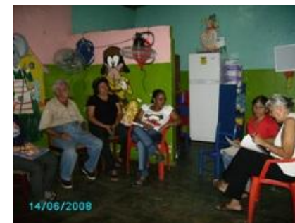
Comisiones Promotora y Electoral en reuniones en el Simoncito "Pasitos de Ángeles"